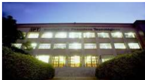
Fotografia 1 – Fachada do prédio Adriano Marchini